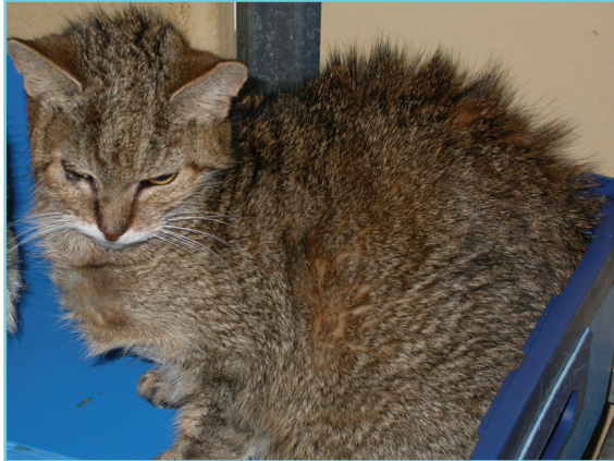
Chat atteint de rétrovirose, noter l'écoulement oculaire, l'attitude prostrée du chat, le poil hirsute.

Le diagnostic repose avant tout sur les éléments épidémiologiques* et les constatations cliniques réalisées par un vétérinaire.